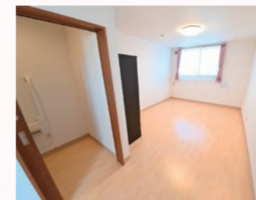
全室完全個室 プライバシーにも配慮