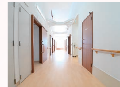
館内 天井が高く明るく開放感のある設計