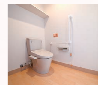
バリアフリー機能付きトイレ 呼び出しボタンも完備